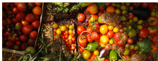
Les fruits du jardin !

La réflexion a débouché sur un projet de LVA : Lieu de Vie et d'Accueil, correspondant à notre vision d'un projet d'hébergement de petite taille qui puisse pleinement s'intégrer à la dynamique locale. Nous sommes en dialogue avec l'Arche de Jean Vanier, avec qui nous partageons pleinement les valeurs et la vision de l'accueil de la personne ayant un handicap mental, avec la question: notre LVA sera-t-il une « communauté de l'Arche » ?