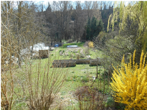
« Le jardin de l'Accueille »