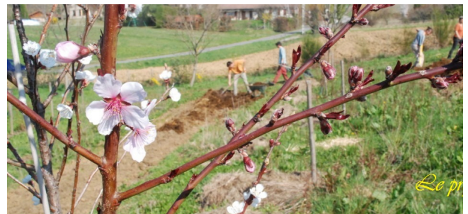
Le « verger du p'tit bonheur »

Cela ne sert pas uniquement d'outil pédagogique mais également à contribuer à nourrir la population avec des productions de qualité.