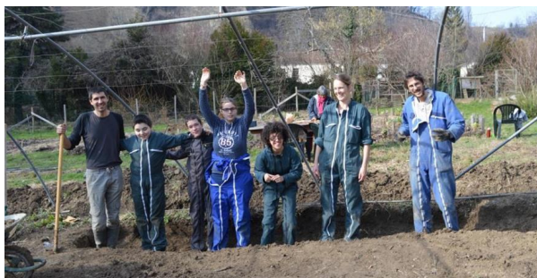
L'IME de Roybon

Les activités de jour démarrent timidement au printemps 2016 et prennent de l'ampleur à partir de septembre 2016 et du printemps 2017. Cinq partenaires privilégiés s'engagent de façon régulière dans les activités proposées :