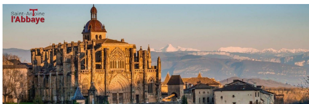
Le Village de St-Antoine l'Abbaye

L'association Binettes et Compagnie a pour objet de « permettre à des personnes avec et sans handicap mental de co-construire un lieu de vie fraternel, convivial et ouvert, s'inscrivant dans l'environnement social, culturel et économique du territoire, afin de répondre aux besoins et aspirations profondes des personnes et de contribuer à transformer le regard sur le handicap et les différences. »